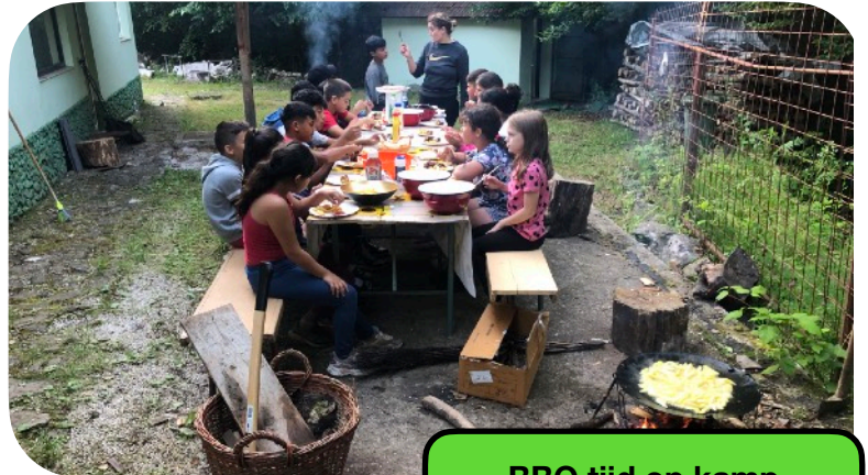
BBQ tijd op kamp