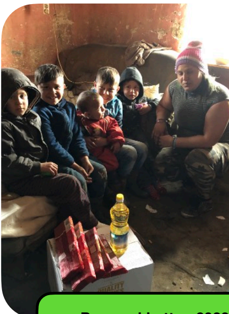
Paas pakketten 2023