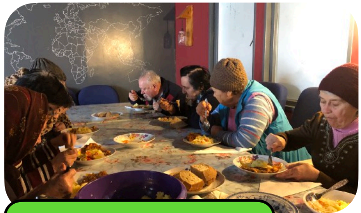
Gezamenlijk eten met de ouders