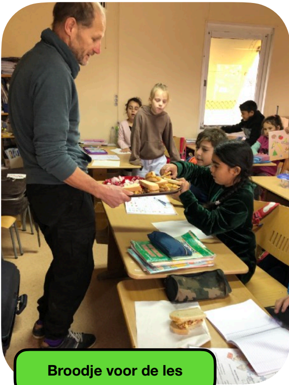
Broodje voor de les