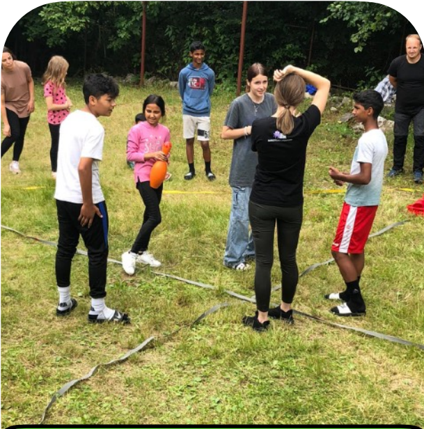
Kamp spelletjes met een team uit Oradea