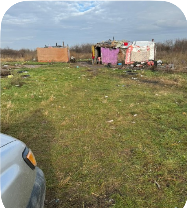
De foto heb ik gemaakt tijdens het uitdelen van de kerstpakketten, net buiten Oradea