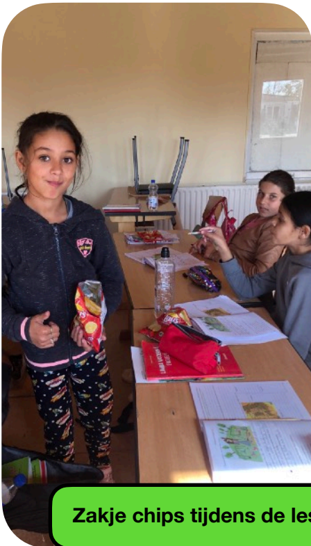
Zakje chips tijdens de les