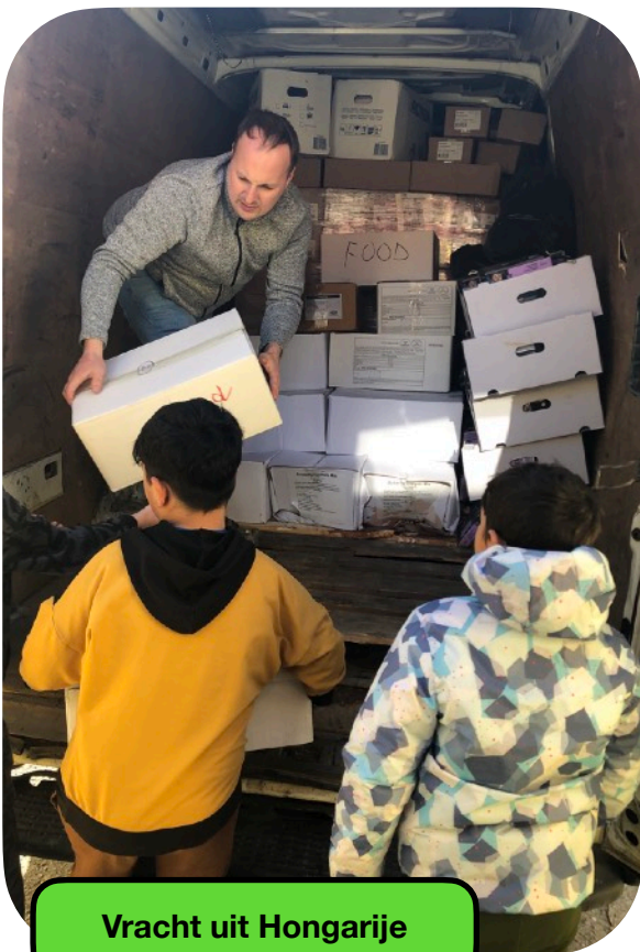
Vracht uit Hongarije

De foto hiernaast is er eigenlijk eentje uit 2024 hoe die in de uitgekozen foto's terecht kwam weet ik niet, maar wilde hem niet verwijderen, we hebben met de spullen die we kregen dit jaar alweer veel kinderen en ouders blij mogen maken.