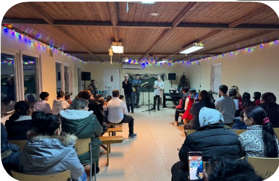
Kerstavond 2023 Hier nodigen we alle ouders uit van de kinderen, en de muziekgroep uit onze kerk in Oradea.