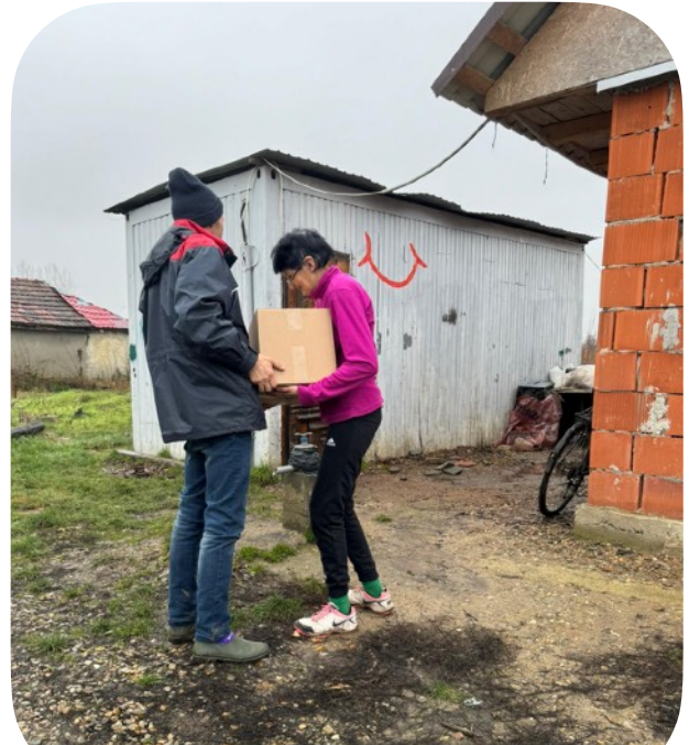
Kerstpakketten uitdelen in Salard, bij ons naast in de straat