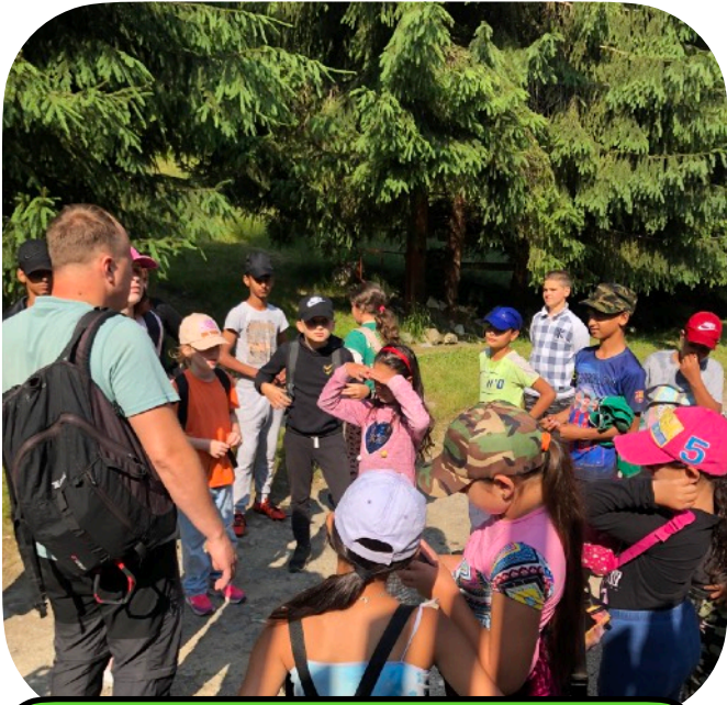
Wandeltocht tijdens het kamp