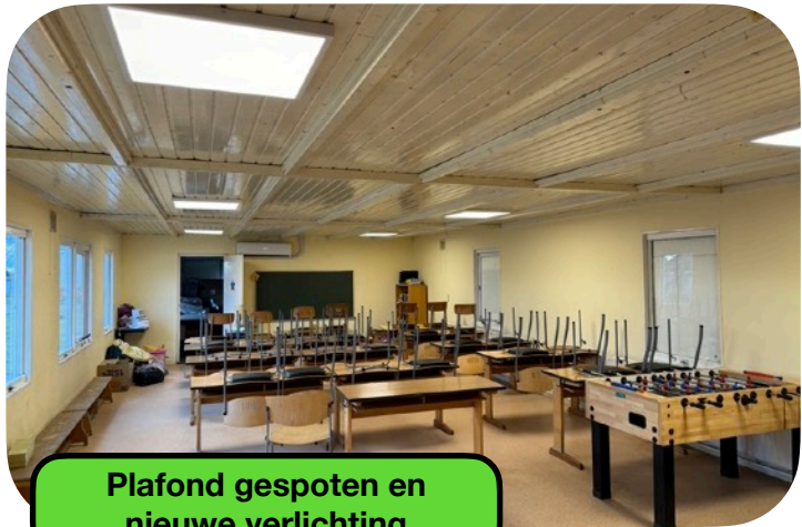
Plafond gespoten en nieuwe verlichting