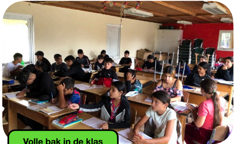
Volle bak in de klas