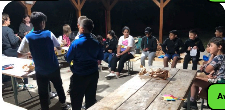
Avond programma kamp