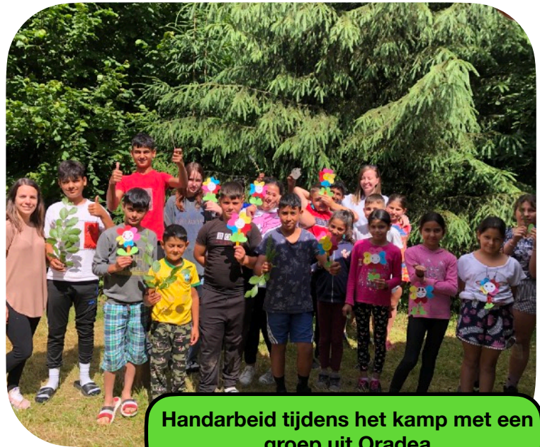
Handarbeid tijdens het kamp met een groep uit Oradea