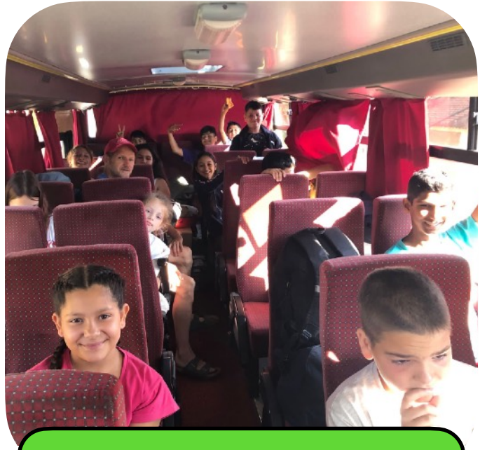
Onderweg naar kamp