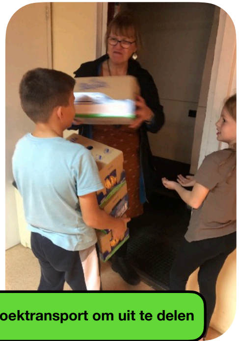
Koektransport om uit te delen