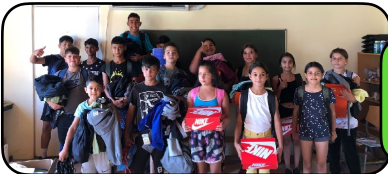
Met nieuwe schoenen en nieuwe tassen kunnen we weer een jaar ertegenaan!