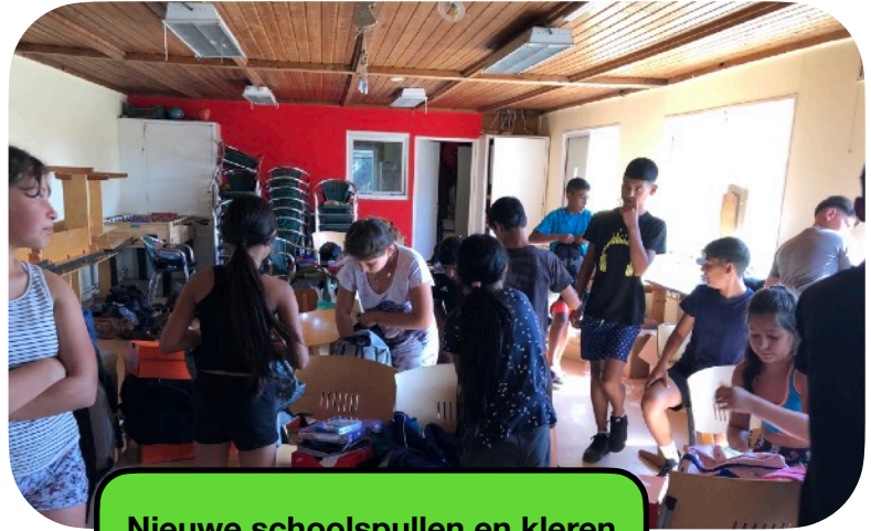
Nieuwe schoolspullen en kleren