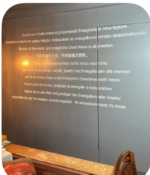
Gaat heen in de gehele wereld, predikt het Evangelie aan alle mensen