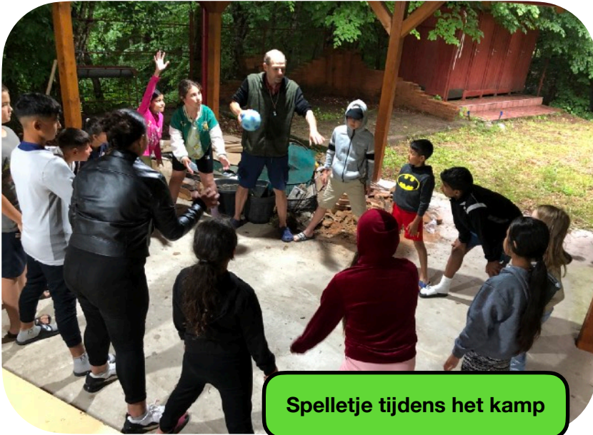
Spelletje tijdens het kamp