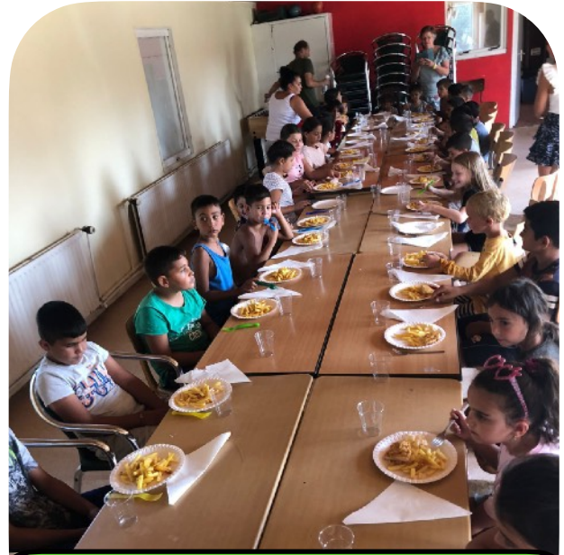
Speciale dag in augustus met een team uit Broek op Langedijk.