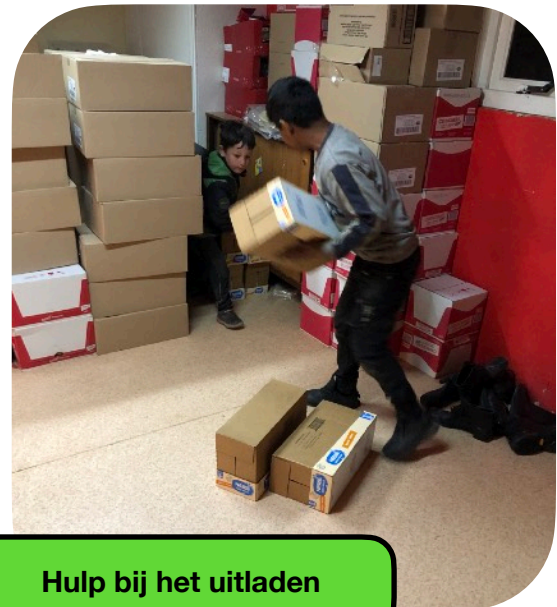
Hulp bij het uitladen