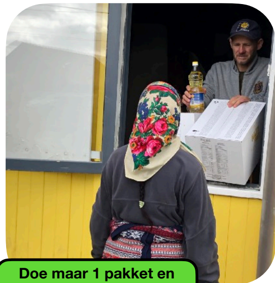
Doe maar 1 pakket en een olie