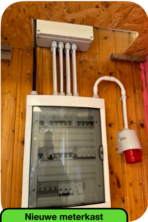
Nieuwe meterkast gemaakt