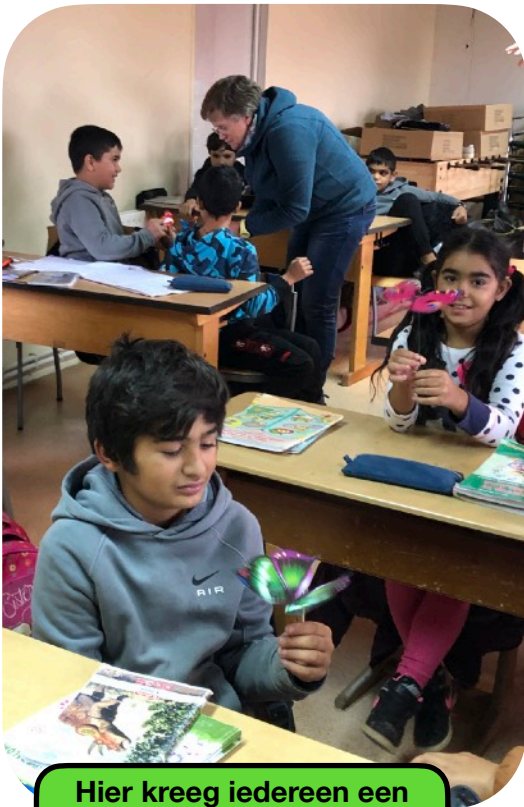
Hier kreeg iedereen een Vlinder