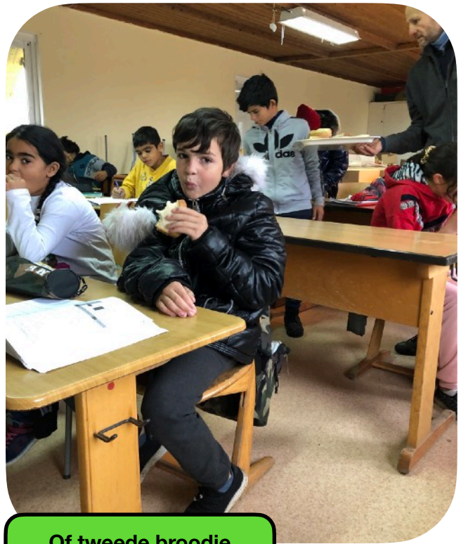
Of tweede broodje