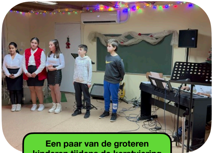
Een paar van de groteren kinderen tijdens de kerstviering